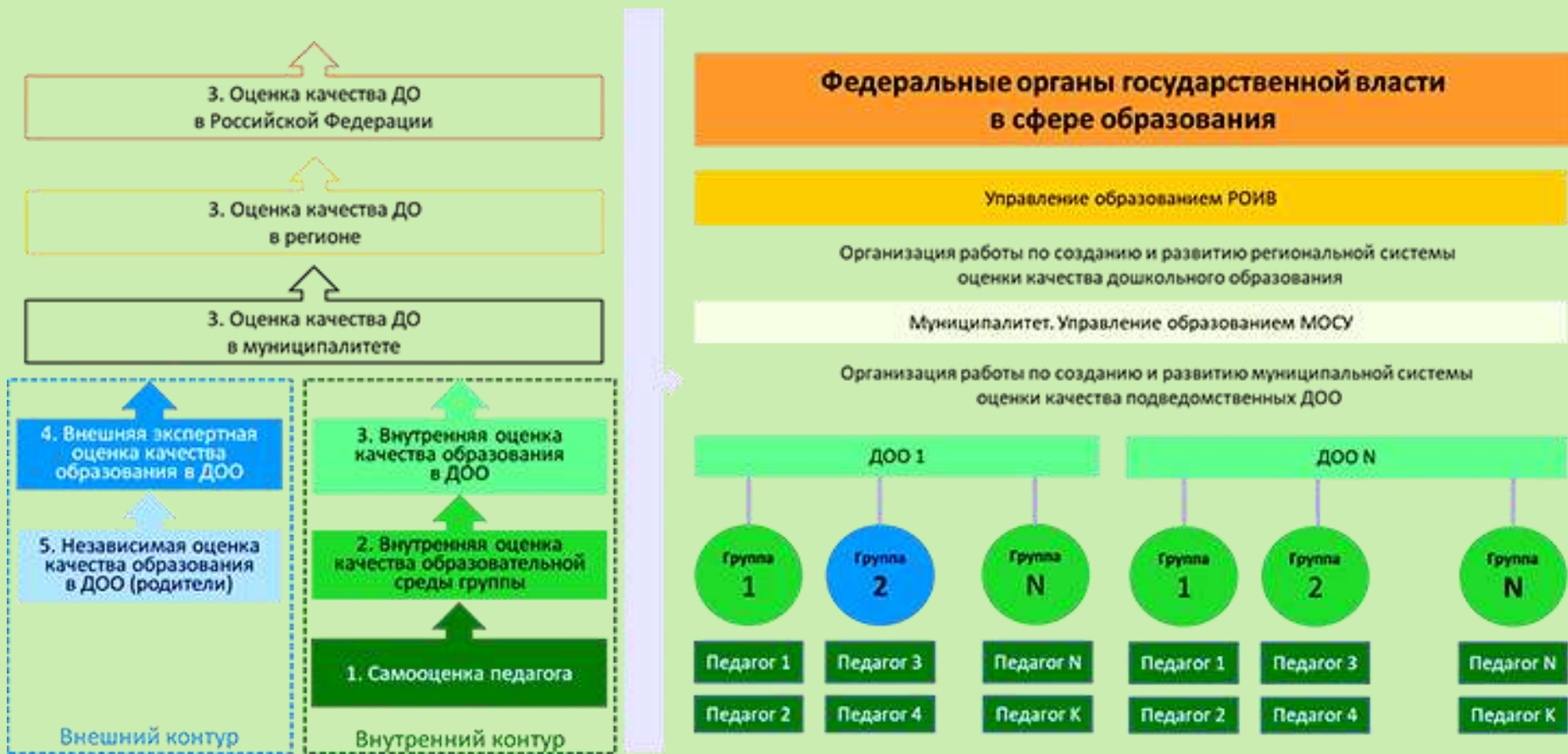
Схема многоуровневого мониторинга качества дошкольного образования